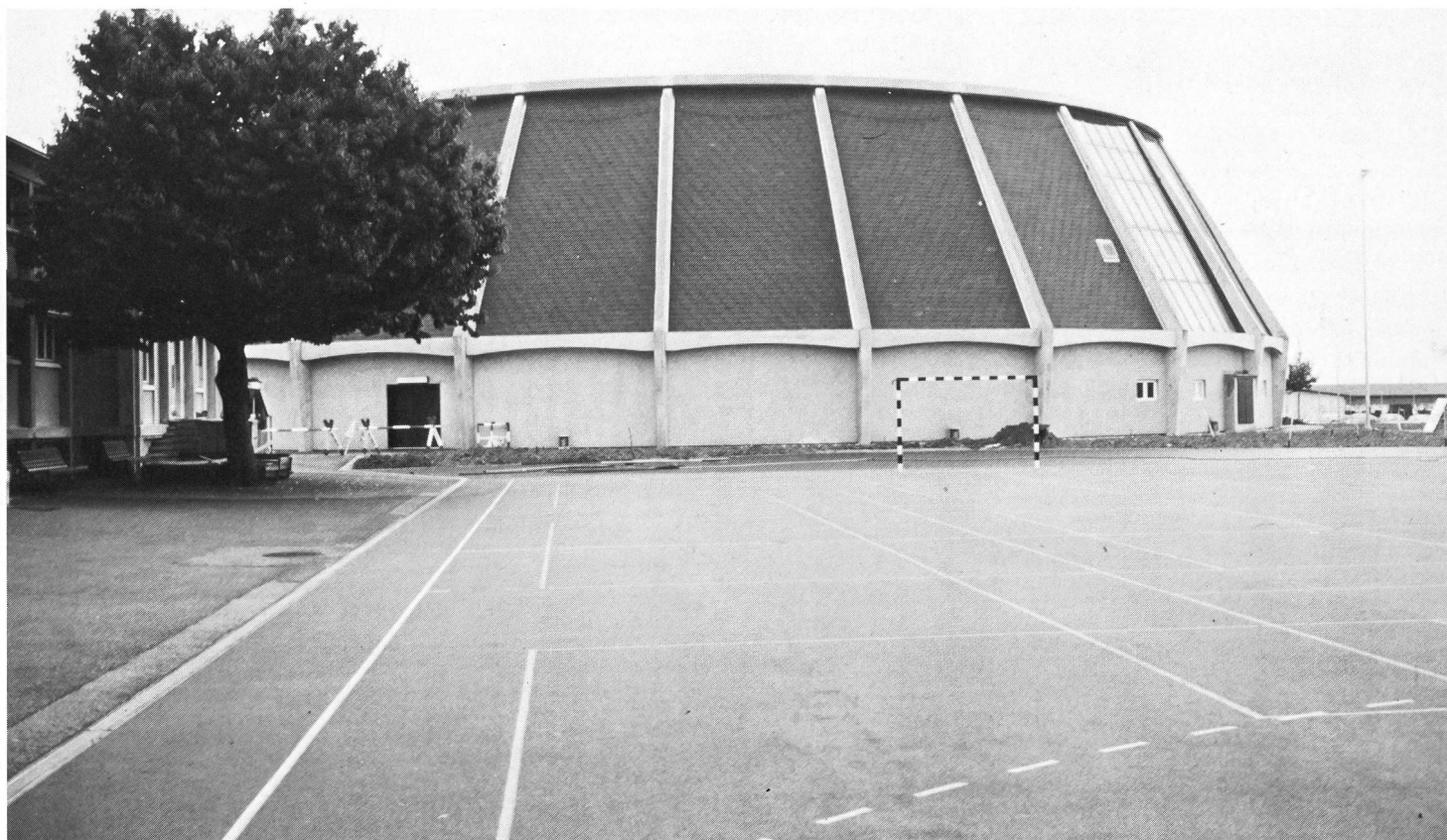
Salle omnisports de la Maladière, Neuchâtel.

munes de Suisse, leur remettant un questionnaire analogue à celui de 1975 et sur lequel on leur demandait de procéder aux tâches suivantes: