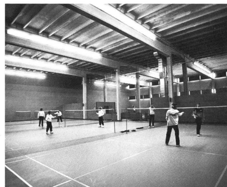
Salle du Centre de badminton de Malley-Lausanne.

En 1983 enfin, après des travaux préliminaires intensifs, l'Office fédéral de la statistique s'est adressé à toutes les com-