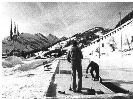
Installation de curling, Mürren.

Dans le secteur des salles de sport, il faut relever une nette augmentation des grandes installations, basées sur la dimension des aires de handball. En ce qui concerne les petites salles – moins de 24 m x 12 m – on enregistre un recul dans plusieurs cantons. Il en est de même pour les terrains de sport gazonnés. L'accroissement le plus spectaculaire touche les salles de tennis et, plus encore, celles de squash. Ceci s'explique en bonne partie par le fait que les installations privées n'avaient pas été prises en compte dans l'inventaire de 1975.