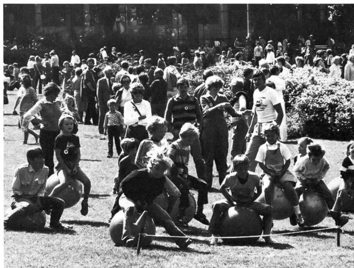
Fêtes de jeux: pas de limites à l'imagination.

ments usent largement de ces possibilités pour faire connaître les «petits jeux» dont voici quelques exemples: