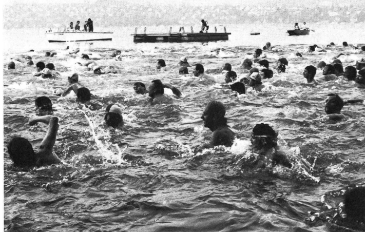
Traversée populaire d'un lac.