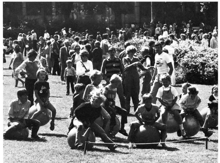
Fêtes de jeux: pas de limites à l'imagination.

ments usent largement de ces possibilités pour faire connaître les «petits jeux» dont voici quelques exemples: