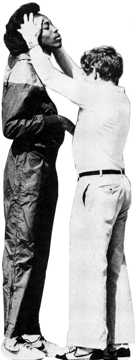
L'entraîneur prend une place active à la régénération de l'athlète.

La plupart du temps, c'est l'entraîneur qui est fautif!