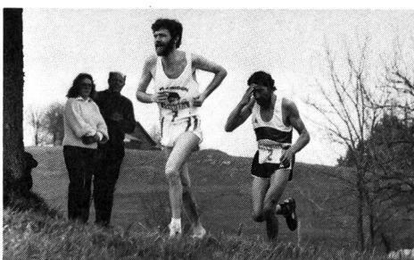
La confiance et le doute.

«Après un grand succès, je m'offre une récompense.» «Je suis en droit de me donner une bonne tape sur l'épaule et de me dire: je l'ai fait!»