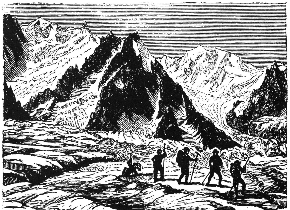
Randonnée dans les Alpes à l'époque de M. de Saussure.

C'est au XVIII e siècle que commencent les voyages d'agrément et d'instruction. Des écrivains chantent les Alpes, par exemple le fameux Albrecht de Haller, de Berne, dans un long poème 1b qui connaîtra de nombreuses éditions. De jeunes aristocrates font leur tour d'Europe et de Suisse pour parachever leur éducation, et ils seront bientôt suivis par des touristes de plus en plus nombreux, ce qui incite John Murray, à Londres, à publier en 1838 un manuel sur la Suisse, un guide si bien fait qu'il sera réédité 19 fois jusqu'en 1904,