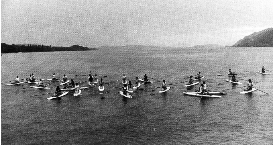
A l'exercice sur la planche à ramer.