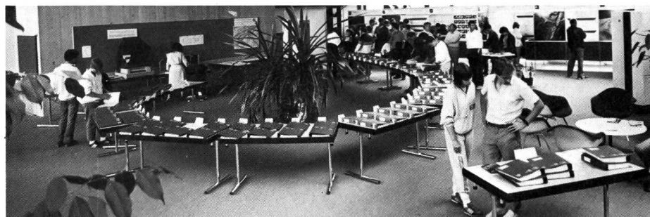
Les manuels J+S exposés à l'aula de l'EFGS.