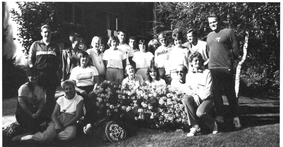
Un cours de moniteurs 1 Fitness «avec le sourire».