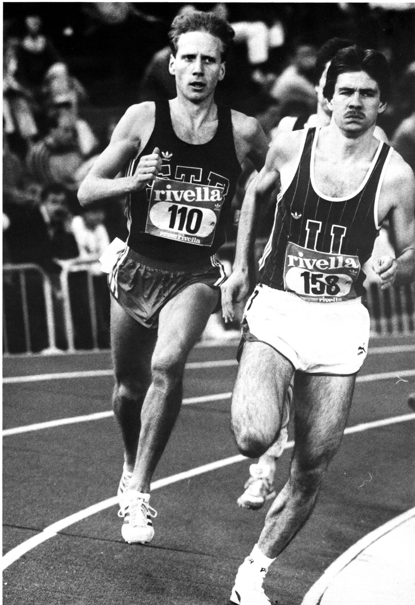
Le cross ou la salle? Une question d'appréciation (à gauche, Peter Wirz, qui fut champion d'Europe du 1500 m en salle).