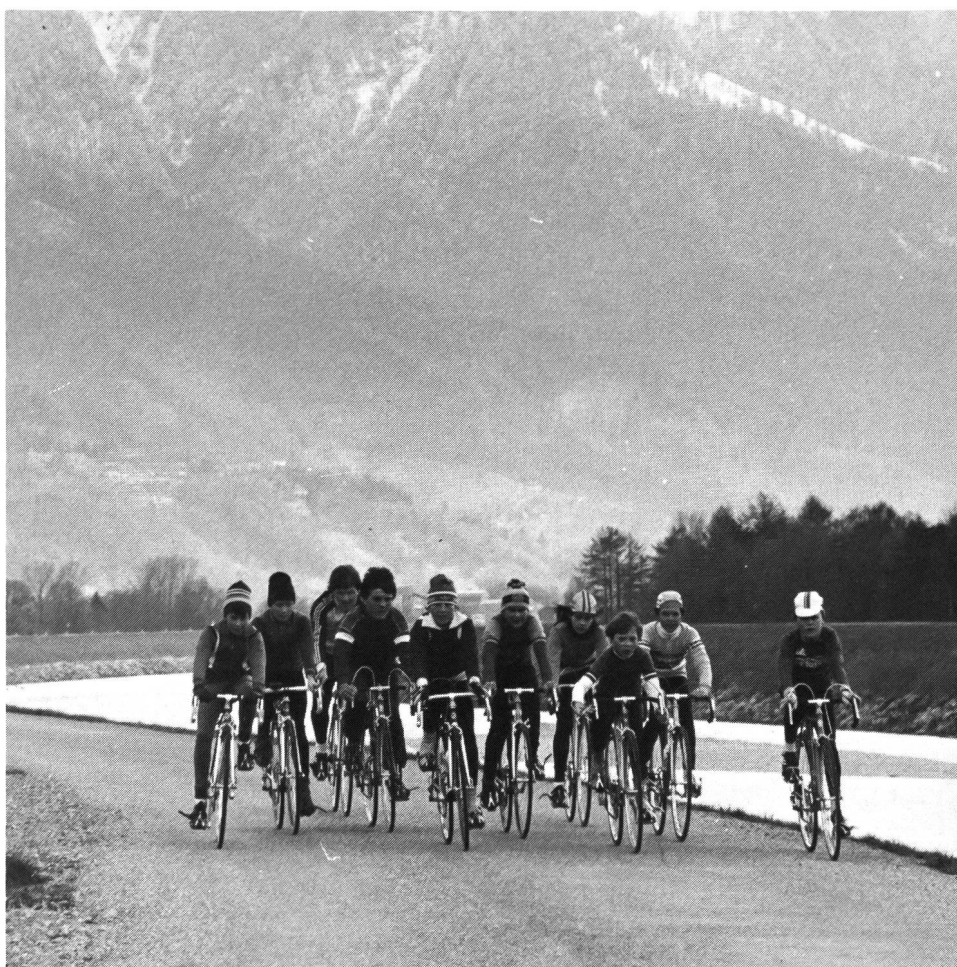
Cyclisme J+S: dix ans déjà.

Pour: camp de sport et de marche – camp de ski (centre de ski Elsigental-Metsch, 2100 m d'alt.)