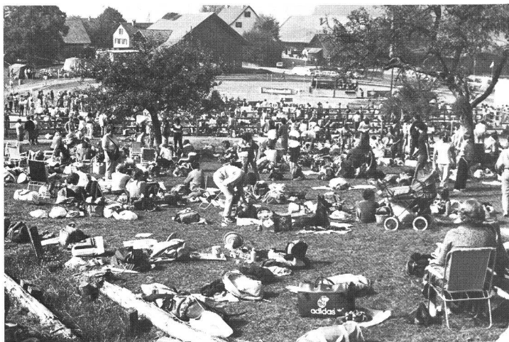
Ambiance de compétition, au Rütihof, au pied du Pfannenstiel, où se situent départ et arrivée de la CO nationale.