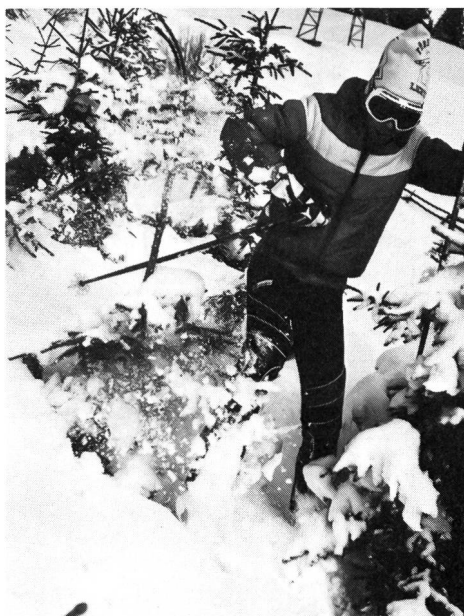
Faudra-t-il en arriver à mettre des barrières partout?

La planification et l'aménagement de l'environnement devraient déterminer de façon décisive les formes d'action réalisables, encourageant certaines idées tout en écartant d'autres. En conséquence, la conception des installations sportives devrait tenir compte des besoins de toutes les couches de la population, ainsi que des différentes fonctions inhérentes ou attribuées au sport.