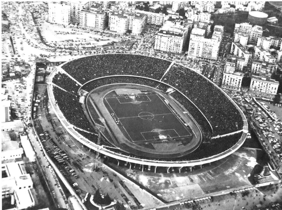
Le stade San Paolo en pleine ville de Naples: harmonie difficile.

gement d'attitude à cet égard. Le sport de demain accusera une hausse encore plus marquée du phénomène de masse, tout en développant de nouvelles formules dans le domaine du jeu et de la compétition.