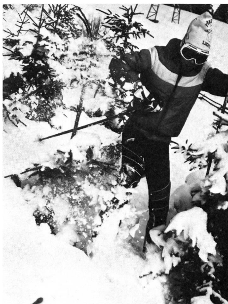
Faudra-t-il en arriver à mettre des barrières partout?

La planification et l'aménagement de l'environnement devraient déterminer de façon décisive les formes d'action réalisables, encourageant certaines idées tout en écartant d'autres. En conséquence, la conception des installations sportives devrait tenir compte des besoins de toutes les couches de la population, ainsi que des différentes fonctions inhérentes ou attribuées au sport.