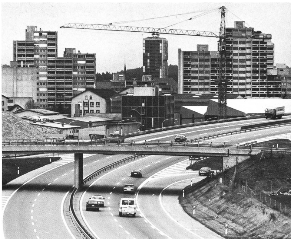
Béton total! Préserver le paysage? Pas si facile!...

Sur le plan de la réalisation, l'aménagement du territoire est en pleine crise. Les délais impartis par la loi fédérale pour l'élaboration des plans directeurs cantonaux (1er janvier 1985) et pour la réorientation des plans d'affectation (1er janvier 1988) n'ont pas été et ne seront pas respectés. C'est aux autorités que s'adressent avant tout les reproches de défaillance: elles n'ont pas tout mis en œuvre pour réaliser