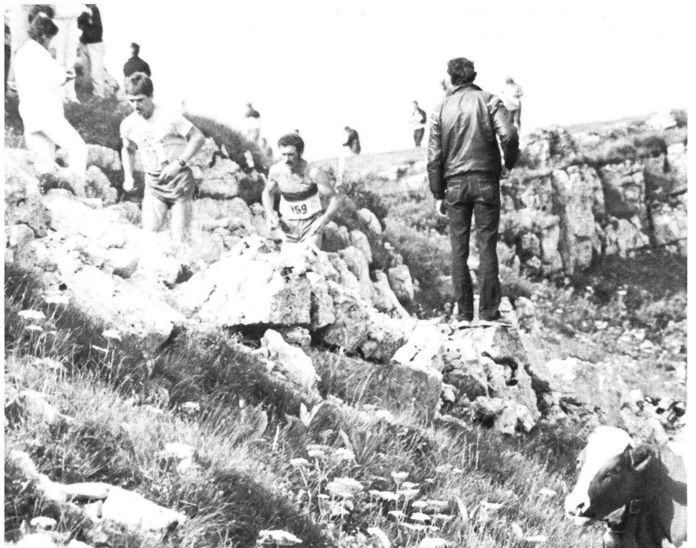
... ni la chaîne du Chasseral, bucolique et pourtant pleine d'embûches.