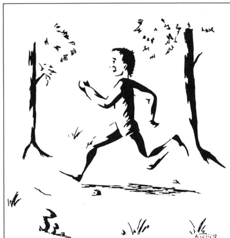
Le footing en sous-bois: une excellente «médecine verte»

Michel Grosbois 17, chemin des Laurelles 1196 Gland