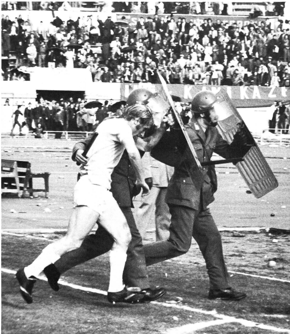
Un service d'ordre efficace dès avant le match, pour ne pas en arriver là.

En outre, nous organisons régulièrement des rencontres avec les comités des «fans-clubs» (ils sont très nombreux en Suisse centrale). L'entraîneur et certains joueurs sont également présents et de nombreuses divergences de vues peuvent être ainsi