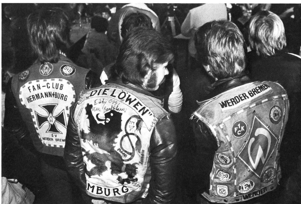
Ils font peur, souvent à tort.