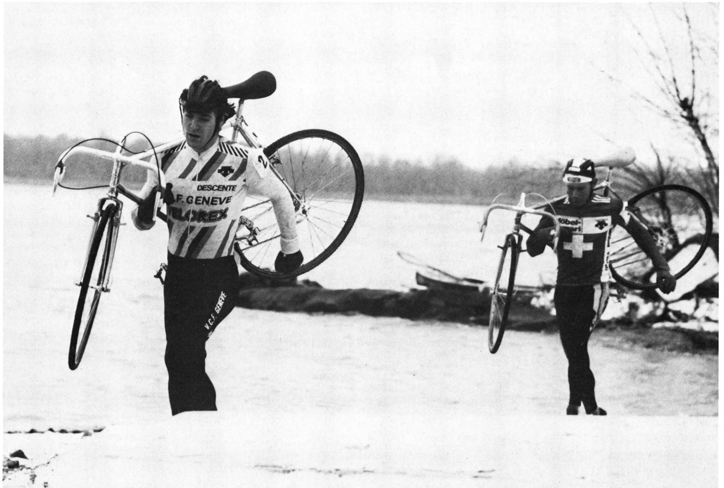
...et dans l'ordre inverse.

Depuis quelques années, les courses au titre ne se disputent plus sur une distance donnée, mais sur un certain laps de temps plus un tour. Raison de cette modification: suivant les conditions de terrain, le temps de course pour une même distance peut passer du simple au double. La nouvelle réglementation est cependant peu satisfaisante, les derniers Championnats du monde l'ont démontré.