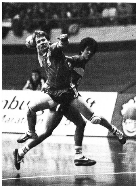
Corée - Islande.

L'adaptation du «reportage illustré» d'Hugo Lörtscher, que j'ai présenté dans le précédent numéro de MACOLIN, proposait aux lecteurs l'avis de l'amateur de handball au terme du Championnat du monde organisé en Suisse; celui du simple observateur, aussi, qui découvrit, sur place ou par le biais du petit écran, les traits tout à la fois fascinants et déroutants d'un sport fort méconnu encore, du moins en Romandie. Technicien affirmé et entraîneur reconnu, Urs Mühlethaler fait part, aujourd'hui, de son analyse, appréciation utile et précieux complément d'information. (Y.J.)