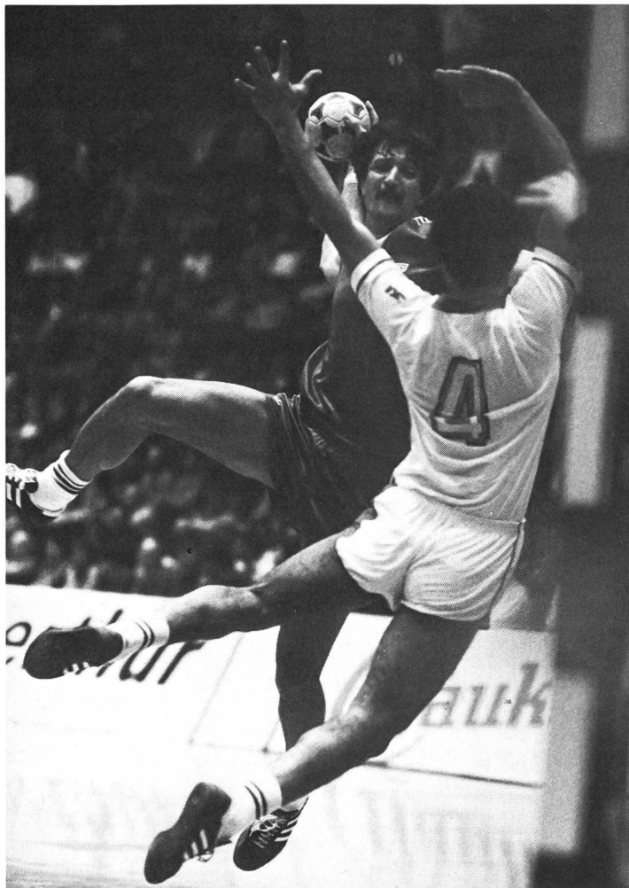
Hongrie – Algérie.