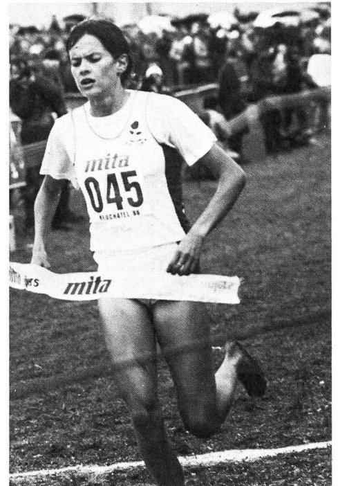
Elle a dix-neuf ans à peine! Frêle, timide, elle a pourtant défrayé les chroniques sportive et politique en raison de ses origines sud-africaines. Britannique maintenant, Zola Budd est à nouveau championne du monde.

Quoi qu'il en soit, au niveau de la course à pied de haute compétition hors stade, le vieux Continent, l'Amérique même, ont dit