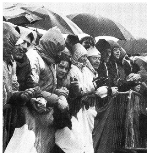
Sous les parapluies, la foule comme un seul homme!