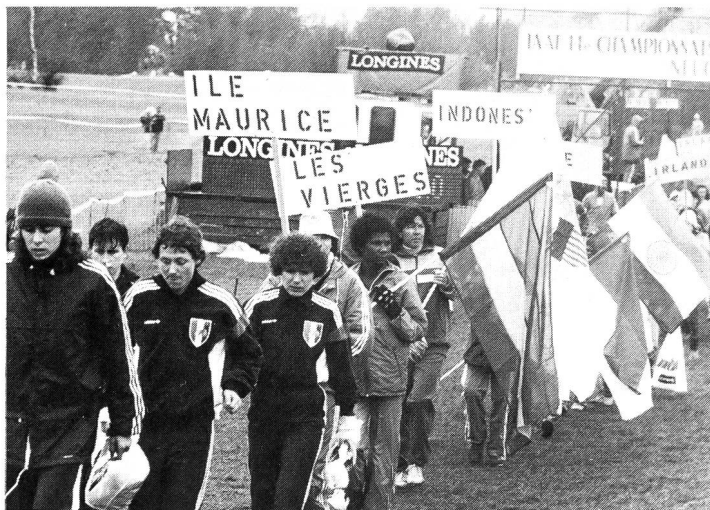
Ce qui fait la richesse du cross-country, c'est son universalité. Pour un temps, il abolit les barrières sociales. La Suisse l'a-t-elle bien compris? Merci, Ile Maurice!