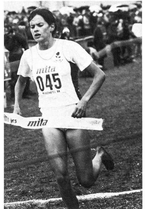
Elle a dix-neuf ans à peine! Frêle, timide, elle a pourtant défrayé les chroniques sportive et politique en raison de ses origines sud-africaines. Britannique maintenant, Zola Budd est à nouveau championne du monde.

Quoi qu'il en soit, au niveau de la course à pied de haute compétition hors stade, le vieux Continent, l'Amérique même, ont dit