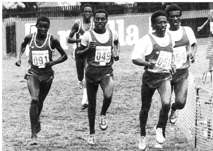
Comme les Kenyens chez les seniors, les Ethiopiens ont dominé la course des juniors, remportant une cinquième victoire par équipes en cinq participations.