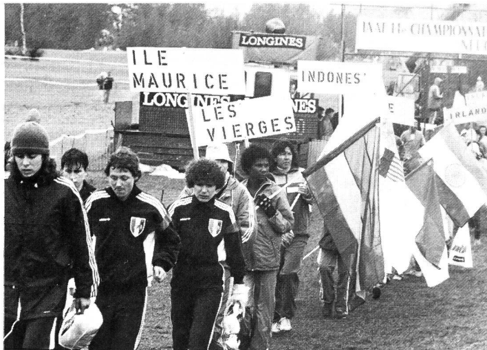
Ce qui fait la richesse du cross-country, c'est son universalité. Pour un temps, il abolit les barrières sociales. La Suisse l'a-t-elle bien comprise? Merci, Ile Maurice!