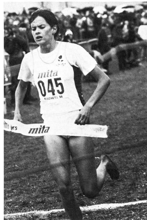
Elle a dix-neuf ans à peine! Frêle, timide, elle a pourtant défrayé les chroniques sportive et politique en raison de ses origines sud-africaines. Britannique maintenant, Zola Budd est à nouveau championne du monde.

Quoi qu'il en soit, au niveau de la course à pied de haute compétition hors stade, le vieux Continent, l'Amérique même, ont dit