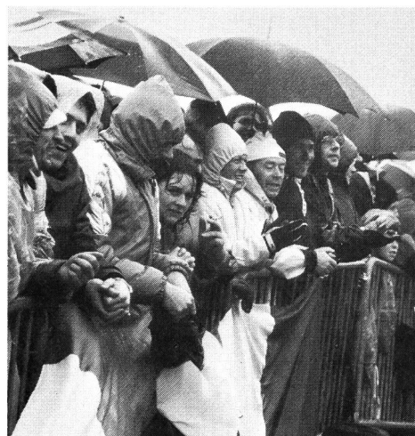
Sous les parapluies, la foule comme un seul homme!