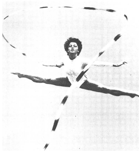
Au centre du sport, le mouvement!

Un très grand nombre d'exemples plus ou moins nébuleux pourraient être donnés pour étayer ces dires. La discussion ne souffre aucune objection: le sport n'est plus ce qu'il était. Tenter de découvrir le sens profond du sport, c'est également chercher à savoir quelle est la véritable nature de l'homme. En d'autres termes, c'est la nature profonde de l'homme qui détermine le sens – ou l'absence de sens – d'un domaine aussi malléable que celui du sport, mais ceci est vrai aussi pour... la musique par exemple, ou pour les arts plastiques. Il s'agit, là, d'un processus irréversible! Si Plessner a sans doute raison lorsqu'il dit: «Libre de toute attache de lieu et de durée, plongée dans le vide, la nature humaine fuit inexorablement devant son ombre sans possibilité de retour», je crois pouvoir affirmer, pour ma part que, par le sport, nous connaissons le même cheminement. Ici aussi, il n'y a pas de retour, ni vers les louables valeurs éducatives du bon Jahn, le «père de la gymnastique», ni vers les objectifs hautement moraux de l'ancienne noblesse anglaise. Mais, si tout retour nous est interdit, rien ne nous empêche d'aller de l'avant, de marcher avec notre temps, avec notre jeunesse, avec «notre» sport: en tirant le meilleur parti des expériences du passé. D'une foulée commune, pénétrons donc dans la nouvelle année!