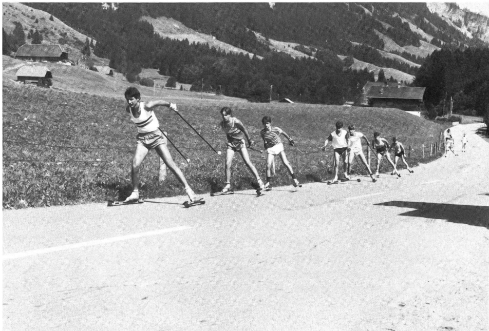
Cadre OJ de la FSS à l'entraînement d'été.

indiscutables sur la santé pourra être préservée, un sport qui conservera, aussi, sa pleine valeur populaire. Vue sous cet angle, la prise de position de la FIS peut être considérée comme bonne et constructive. Mais ce n'est que la phase d'application qui montrera dans quelles proportions elle est réaliste à moyen, voire à long terme! ■