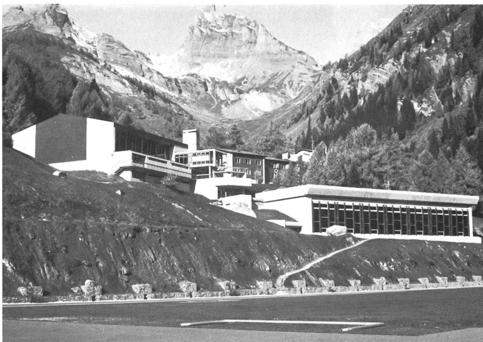
Le centre sportif valaisan d'Ovronnaz.

K. Wolf: J'ai toujours été opposé, même si je suis un fédéraliste convaincu, à la création de centres sportifs (mis à part Tenero, dont la fonction est très particulière) dépendant de Macolin. Je suis d'avis que, si une région désire un centre, elle doit en entreprendre la réalisation elle-même et en assumer elle-même la direction et la gestion. On a des exemples de cantons et même de fédérations sportives qui l'ont fait: le Rotsee pour l'aviron, Ovronnaz dans le Valais... Une emprise de l'Etat serait, dans ce cas, plus néfaste qu'utile. Ceci ne veut pas dire que le problème de la culture et des langues soit résolu à l'EFGS!