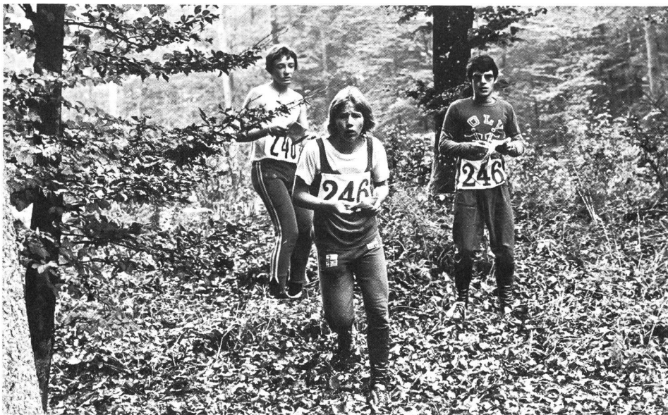
S'ils tiennent à garder accès à la forêt, ils doivent la respecter.

MACOLIN: Un mouvement est en train de se développer, dans la partie nord de l'Europe, sous le nom de «Sport pour la paix». De quels yeux voyez-vous cette vague rouler en direction de la Suisse?