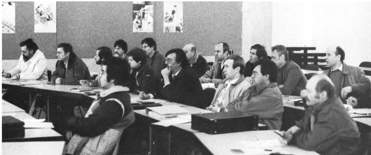
Entraîneurs et experts à l'écoute du maître.

c'est la clarté, la transparence et les relations de confiance qu'il parvient à établir avec ses joueurs. Je ne suis pas un... dictateur, mais j'aime la discipline. Elle est à la base de la progression contrôlée. Aux USA, j'ai appris à distinguer les relations qui peuvent exister entre un entraîneur et ses joueurs dans le cadre de l'activité sportive d'une part, en dehors de celle-ci de l'autre. Sur le terrain, l'entraîneur doit donner des directives précises et les faire respecter; à l'«extérieur» par contre, il ne peut distribuer que des conseils, puisqu'il n'a aucun moyen de contrôle.