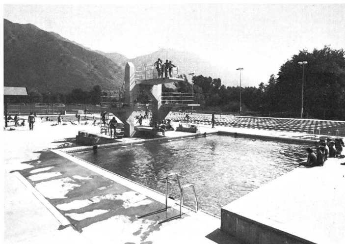
Bassin des plongeurs.