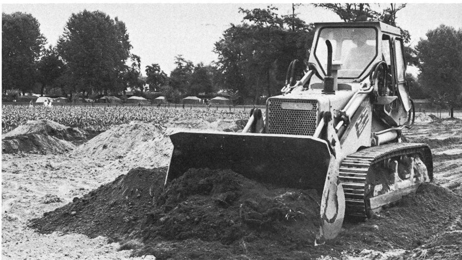
Travaux de remblayage.

Le déblocage des crédits connaissant quelques difficultés et le financement du projet détaillé et des travaux préparatoires prenant du retard, les spécialistes de la construction et de l'exploitation eurent suffi-