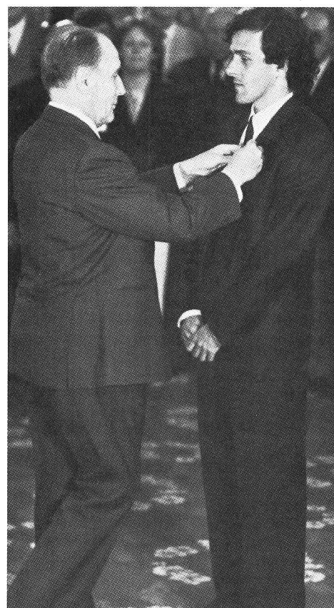
Michel Platini (à droite) nommé chevalier de la Légion d'honneur par M. Mitterrand, Président de la République. (Tiré du prix du mois.)