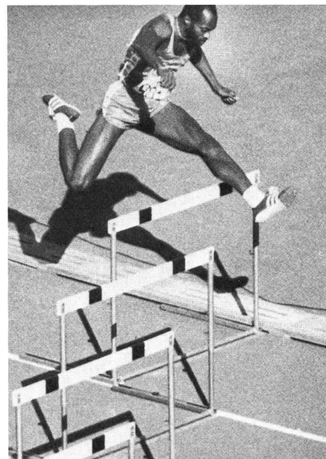
Tiré du prix du mois.

La publication d'un article sur la planche à voile, prévue pour ce numéro, a été différée alors que la grille était déjà faite. Ne cherchez donc pas, dans la présente revue, les éléments qui ont trait au surf.