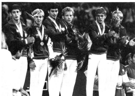
L'équipe américaine victorieuse (voir ci-contre).