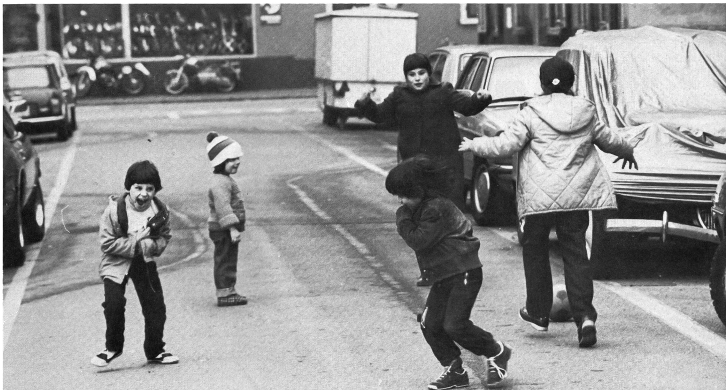
Peu importe... l'environnement, pourvu qu'on ait l'ivresse.