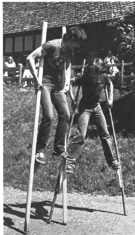
Jeu et sport contribuent au maintien de l'équilibre.