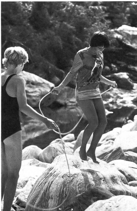
En guise de jeu ou d'entraînement.