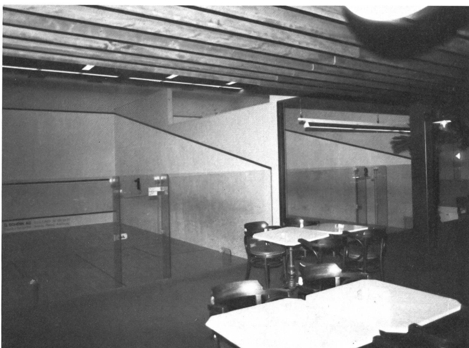
...et de se désaltérer si besoin est!

Secrétariat de l'ASSR Case postale 162 4132 Pratteln Tél. 061 81 38 18 ■