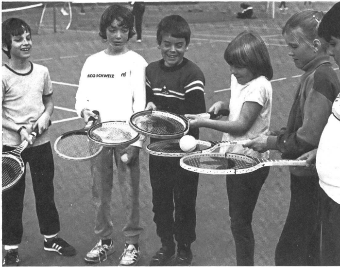
A toi, à moi!