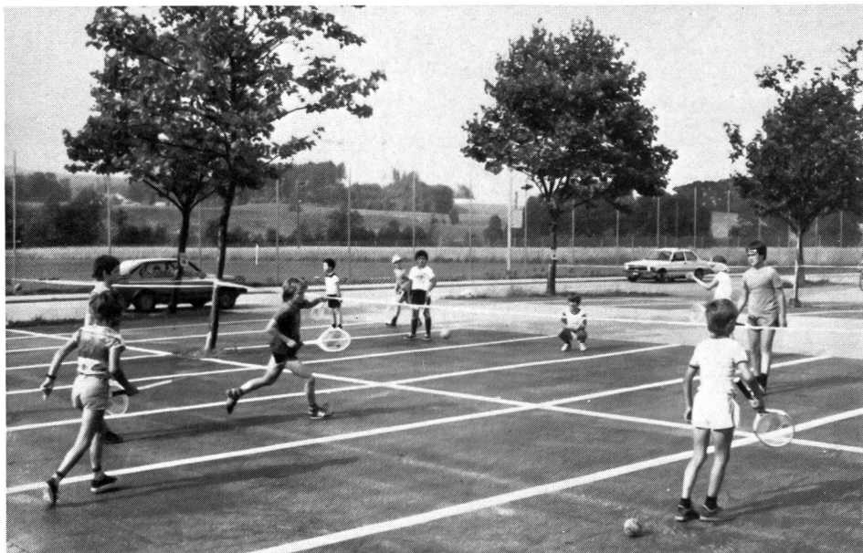
Place de parc: plus de voitures, vive le tennis!

Lorsque l'on maîtrise les coups, on peut se lancer dans la pratique du tennis proprement dit, et, sur ce point, le mini-tennis est la forme qui convient le mieux à l'âge scolaire.