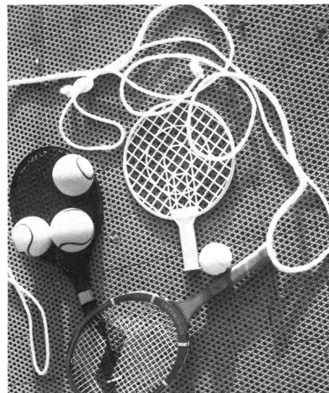
Accessoires en tout genre...

Dès que l'on trouve une surface «libre» et accessible, on peut y jouer au mini-tennis: place de jeu improvisée, cour de récréa-