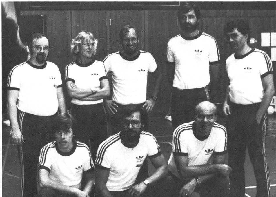
Des organisateurs satisfaits.