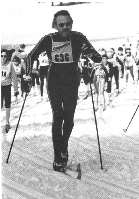
De la politique au ski de fond!

Il y aura dix ans, le 23 juin prochain, que la création du canton du Jura a été décidée. Entrée en souveraineté le 1er janvier 1979, la jeune République et Canton du Jura a inscrit dans sa Constitution, à l'article 30,