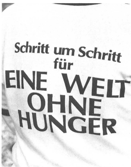
Peu importe la langue...

Lancé de Genève par l'ancien champion de ski Jean-Claude Killy, le relais passera par Lausanne, Fribourg, Berne, Bâle, puis il traversera la France, fera un saut de puce vers Londres avant de s'envoler vers New York. Là, il sera repris par des coureurs dont le dernier arrivera à Los Angeles au début du mois d'août, en plein Jeux olympiques. «Le temps est venu d'agir», proclament les coureurs du Monde, «le temps est venu de créer et de permettre aux autres de vivre.» ■