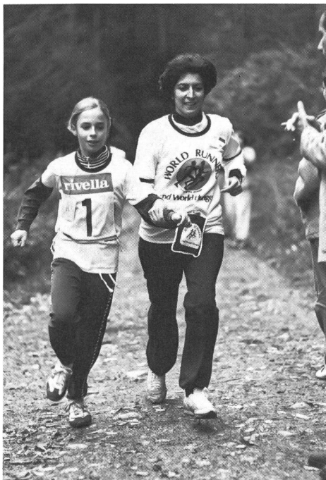
Les «coureurs du Monde» s'entraident pour mieux aider les autres.

conséquences de la faim? Or, la faim pourrait être éliminée, des études scientifiques le prouvent. Mais, pour y parvenir, il faut que la conscience et la volonté collectives soient mobilisées.