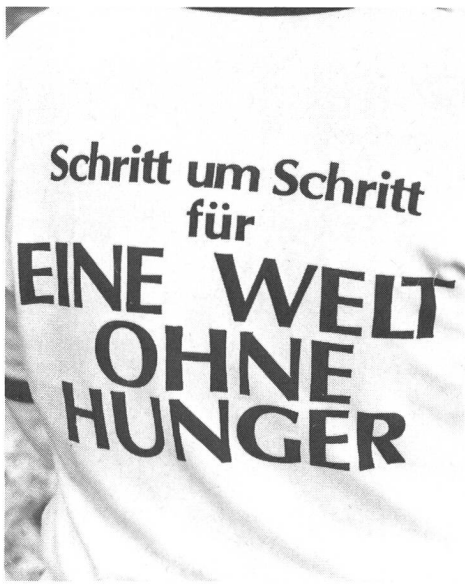
Peu importe la langue...

Les Jeux olympiques ont pour but «d'éduquer la jeunesse par le sport, dans un es-