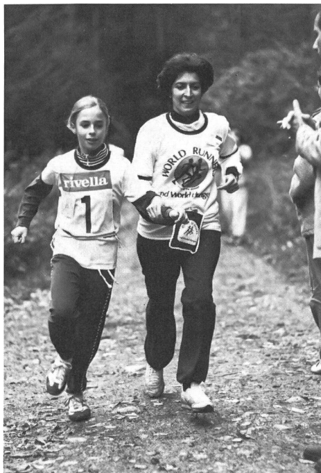
Les «coureurs du Monde» s'entraident pour mieux aider les autres.

conséquences de la faim? Or, la faim pourrait être éliminée, des études scientifiques le prouvent. Mais, pour y parvenir, il faut que la conscience et la volonté collectives soient mobilisées.