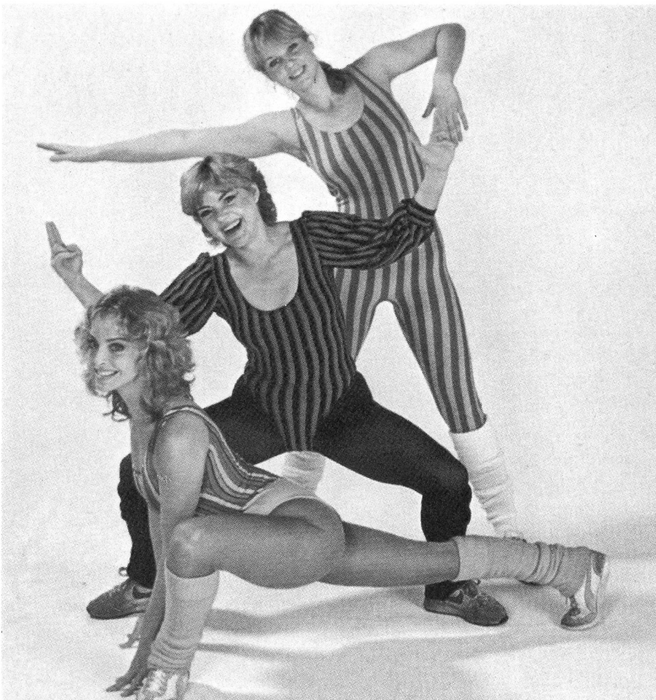
Aérobic: la santé y trouve-t-elle toujours son compte?

Quel entraînement? Et comment? Et pourquoi? Ce livre donne les réponses à toutes vos questions.