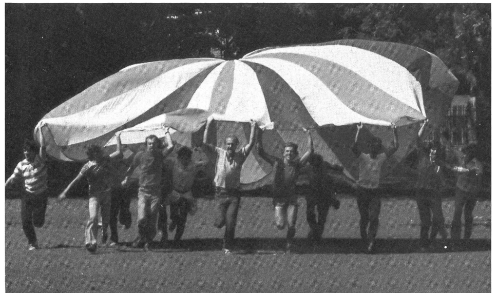
Tiré de la page de couverture de «Jouons ensemble» (prix du mois).

Monsieur Pierre Devaud Ochettaz 12, 1025 St-Sulpice