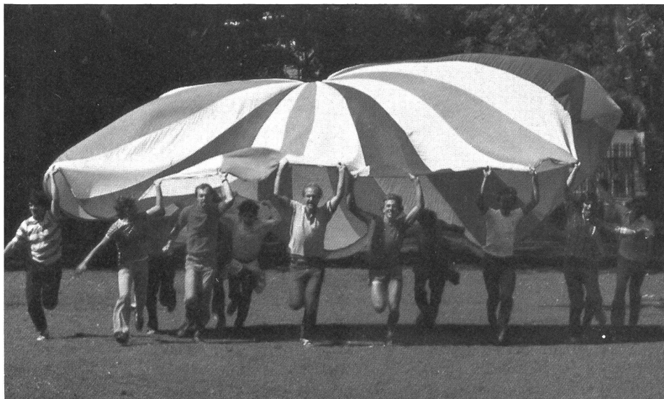
Tiré de la page de couverture de «Jouons ensemble» (prix du mois).