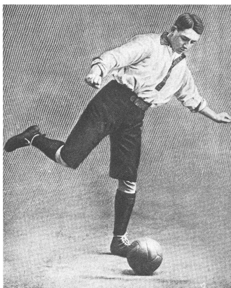
Le renvoi du ballon, style 1900.