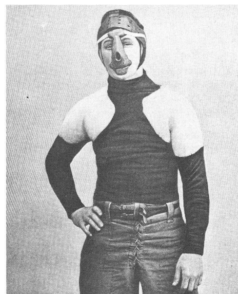
Equipement des débuts du football américain.