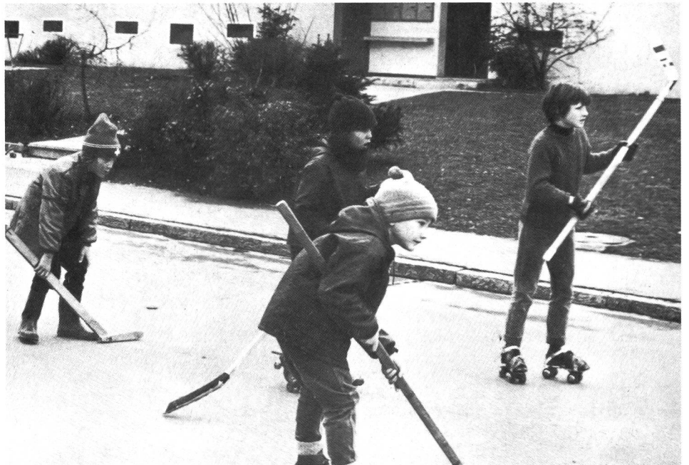
Tirée du livre des Rigassi.