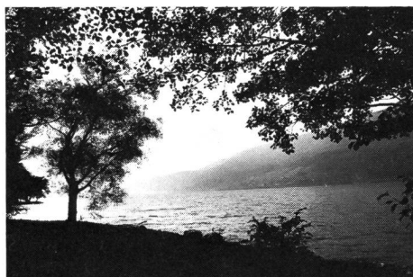
Plus vrai que nature!