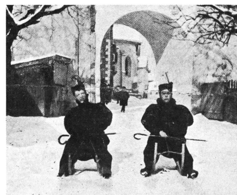
Ici, on préfère le «tobogan».

La vitesse ne tarde pas à devenir considérable et le moindre obstacle occasionne de terribles dégringolades, très rarement graves heureusement.