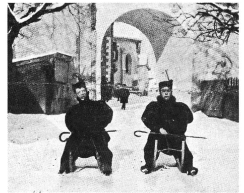
Ici, on préfère le «tobogan».

La vitesse ne tarde pas à devenir considérable et le moindre obstacle occasionne de terribles dégringolades, très rarement graves heureusement.