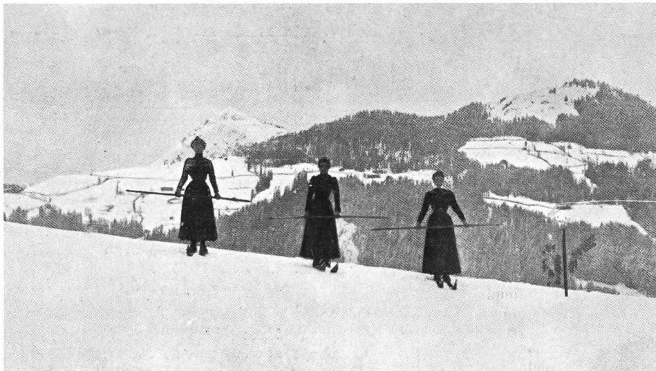
Trois Davosiennes en promenade à skis.