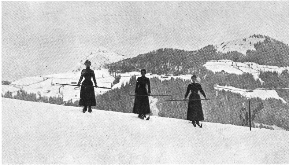
Trois Davosiennes en promenade à skis.