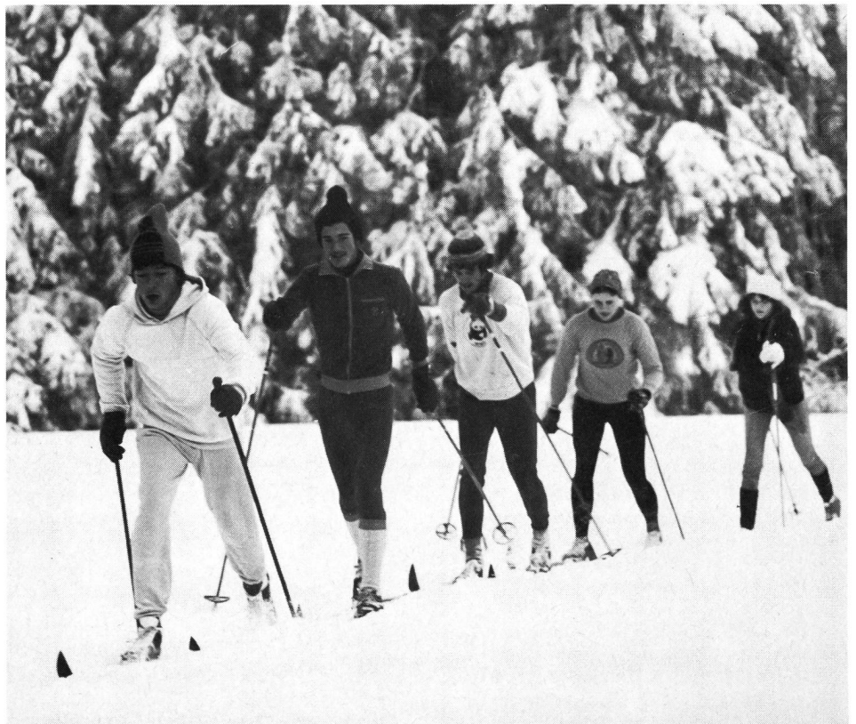
Entraînement de l'endurance générale.

Une spécialisation précoce peut, à long terme, entraver, chez l'enfant, un développement physique et psychique harmonieux (motivation, joie, mouvements unilatéraux, mauvaise coordination, blessures, etc.). Plus l'éventail des habiletés techniques de base du jeune est réduit, plus il lui sera difficile d'accéder au niveau du skieur d'élite.