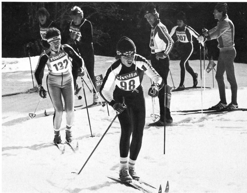
Apprentissage de la compétition.