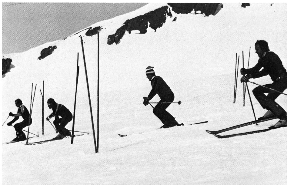
Le slalom parallèle: maîtrise et technique.