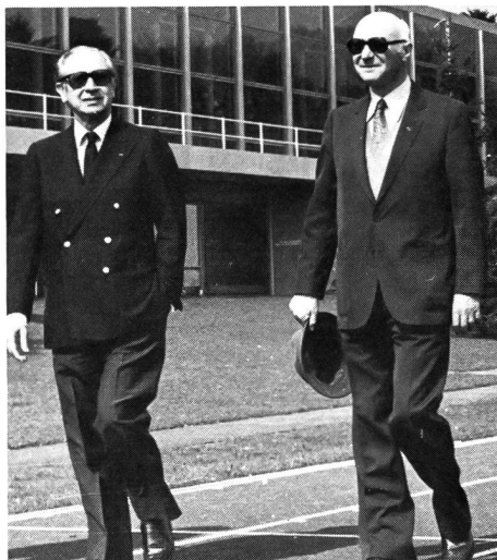
Ils œuvrent certainement pour un «Marathon populaire olympique».