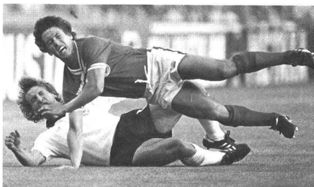
A la limite du fair play...

Elle est particulièrement élevée. Plus de 80 pour cent des personnes questionnées ont indiqué que la campagne pour le fair play avait retenu leur attention, sous une forme ou sous une autre.