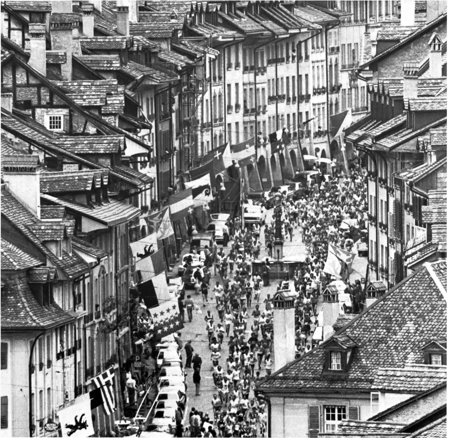
Une course à pied de plus, le Grand Prix de Berne.