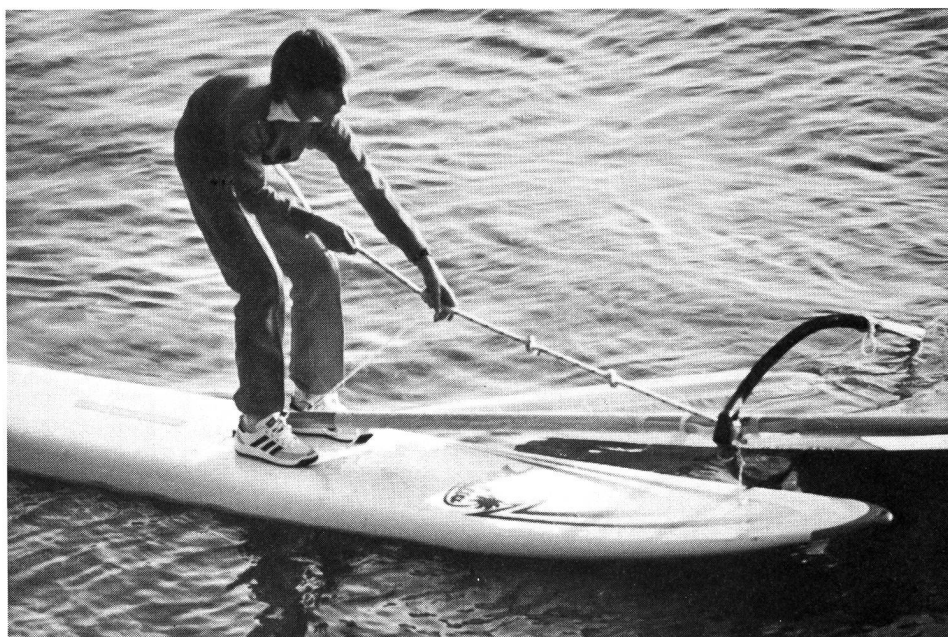
Tirer le gréement sur la planche: une partie de l'eau couvrant la voile s'écoule