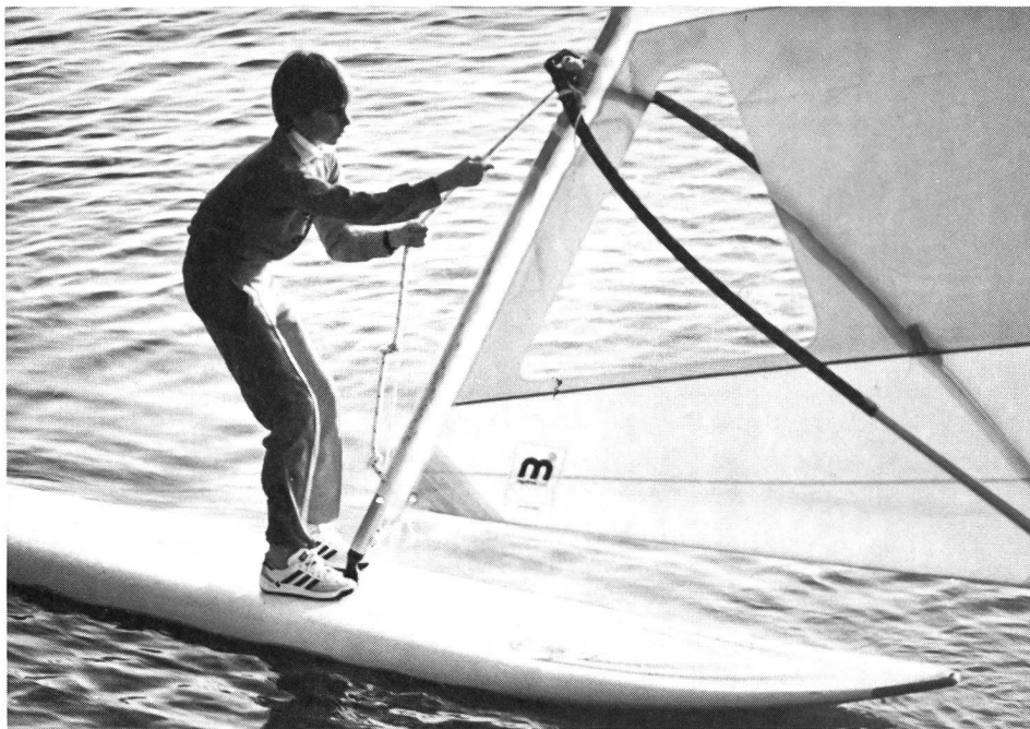
Soulever le gréement et le sortir complètement de l'eau