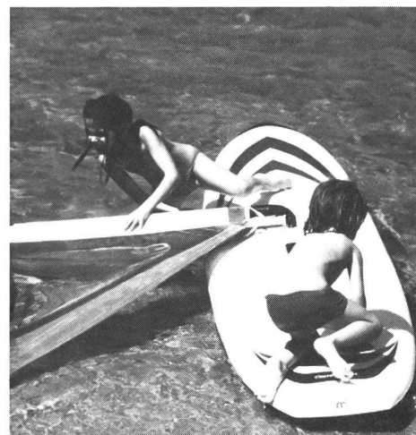
La planche offre d'innombrables possibilités de jeu.