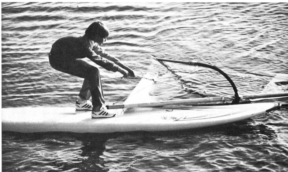
Tirer le gréement hors de l'eau, le mât en direction de la proue ou de la poupe (selon la position de la voile dans l'eau)