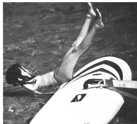
Accoutumance à la planche: quel plaisir de faire une chute!

La planche à voile n'est pas un sport dangereux pour l'enfant si l'on prend certaines précautions! ■