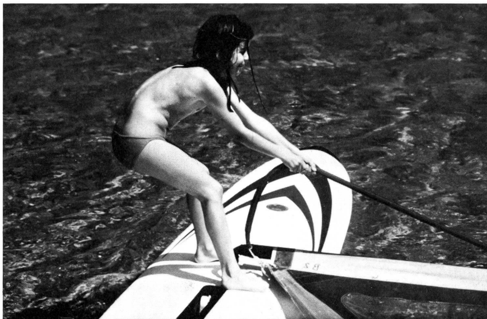
La colonne vertébrale de l'enfant est particulièrement exposée.

Une planche enfant plus petite est certes moins importante qu'un gréement enfant; pourtant, la combinaison planche normale/gréement plus petit comporte un grand