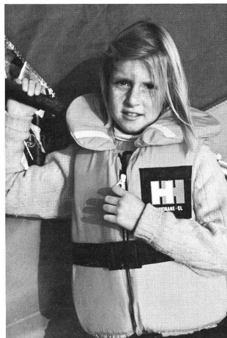
Le gilet de sauvetage est vivement conseillé.