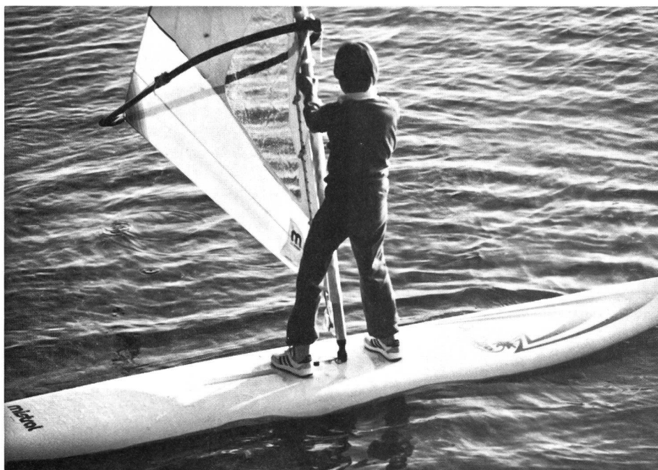
Se mettre en position de base