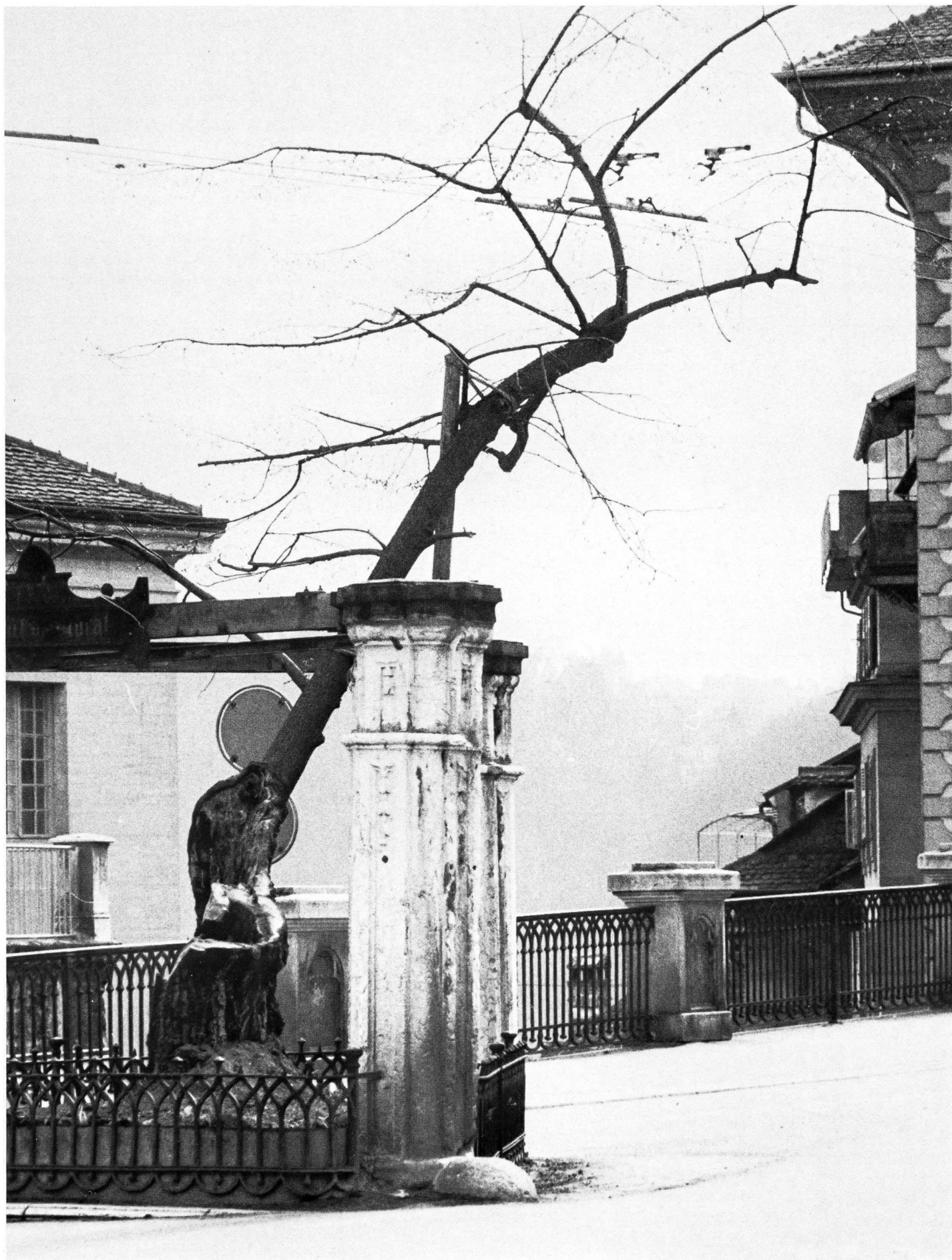
Le vieux tilleul de Morat: il a plus de 500 ans et un automobiliste a failli lui donner le coup de grâce. Mais il résiste et quelque 10 000 coureurs à pied pourront encore le saluer au passage, le 2 octobre prochain, date du 50e anniversaire de la course Morat-Fribourg.