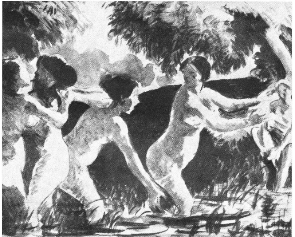
Au bord de l'eau, par Camille Pissarro (1830-1903).