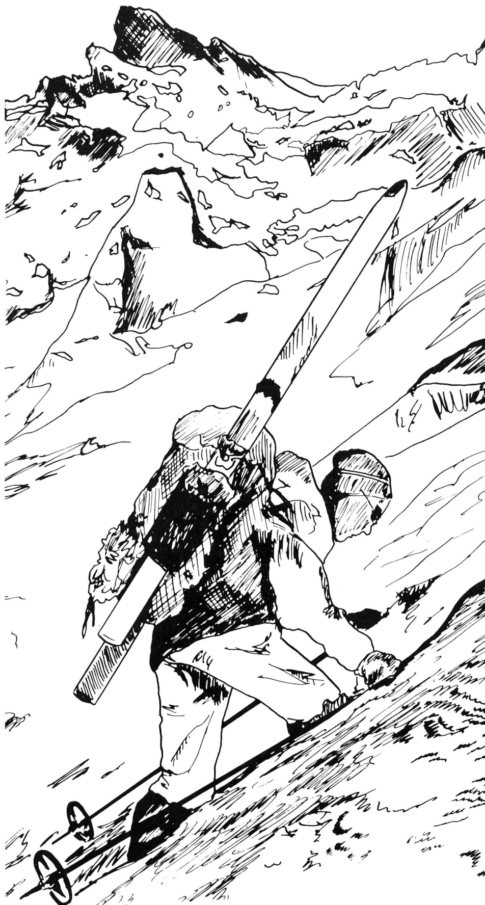
Illustration tirée de «Ski de randonnée» par A. Bartholomé