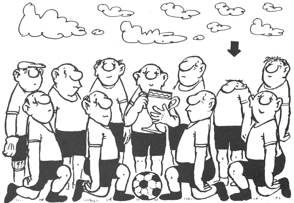
«Le coup de tête décisif»! Dessin de Lorient (Vicco von Bülow).