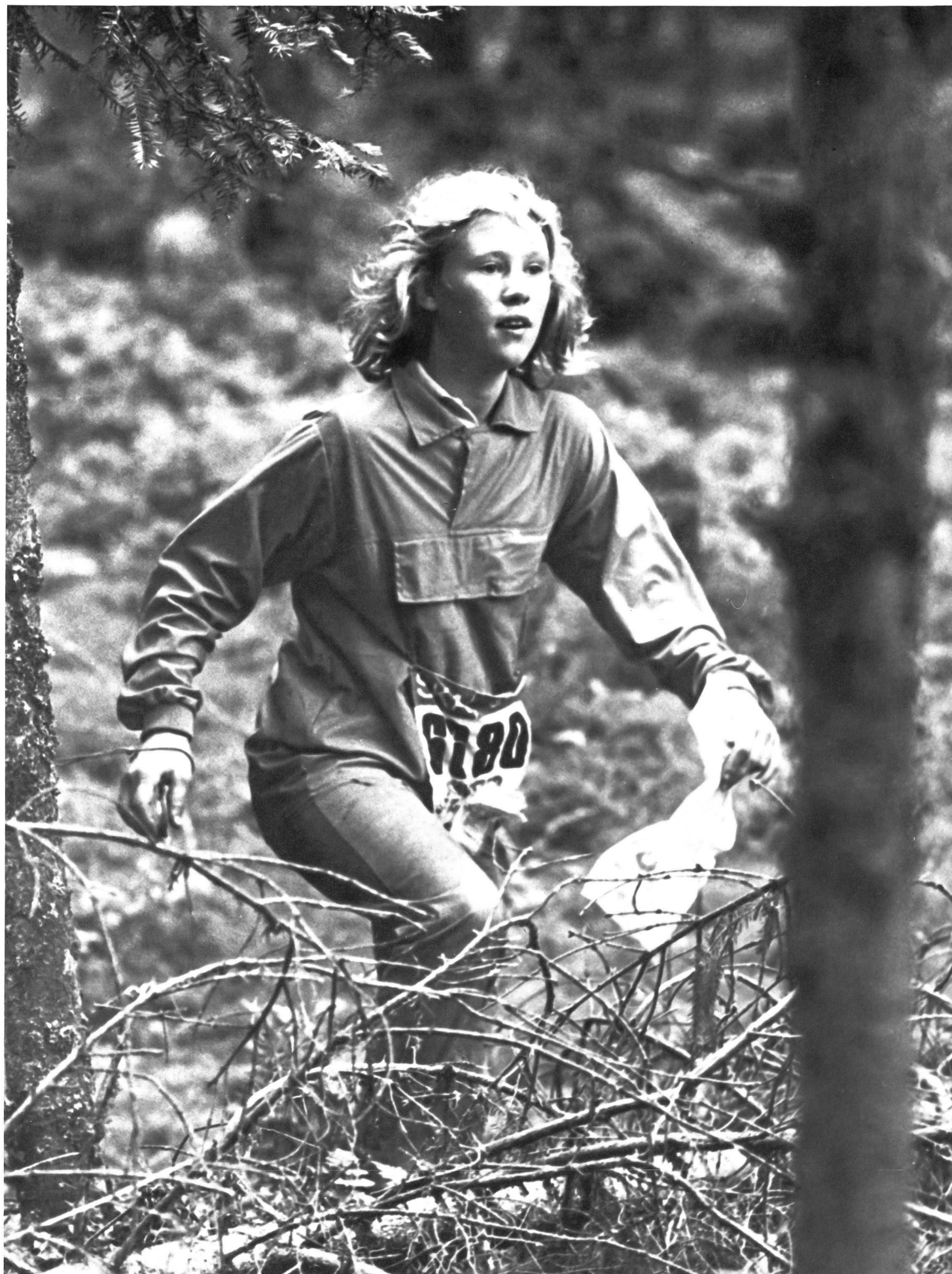
Forêt et course d'orientation: oxygène, engagement, intelligence!