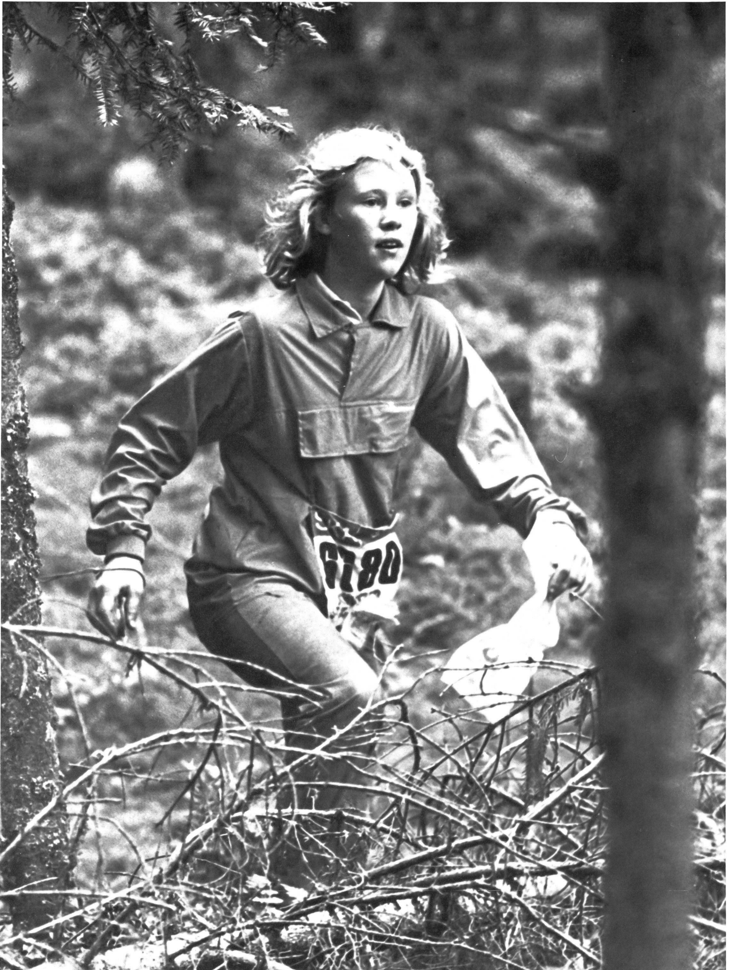
Forêt et course d'orientation: oxygène, engagement, intelligence!