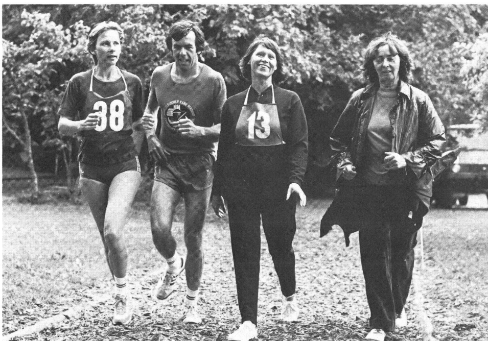
La piste finlandaise: une installation sportive «pour tous».

Les installations de sport qui constituent un élément essentiel de l'infrastructure doivent être intégrées dans l'aménagement du territoire. Autrement, les intérêts sportifs risquent de ne pas être du tout considérés ou de ne l'être que partiellement en raison des structures spatiales pré-