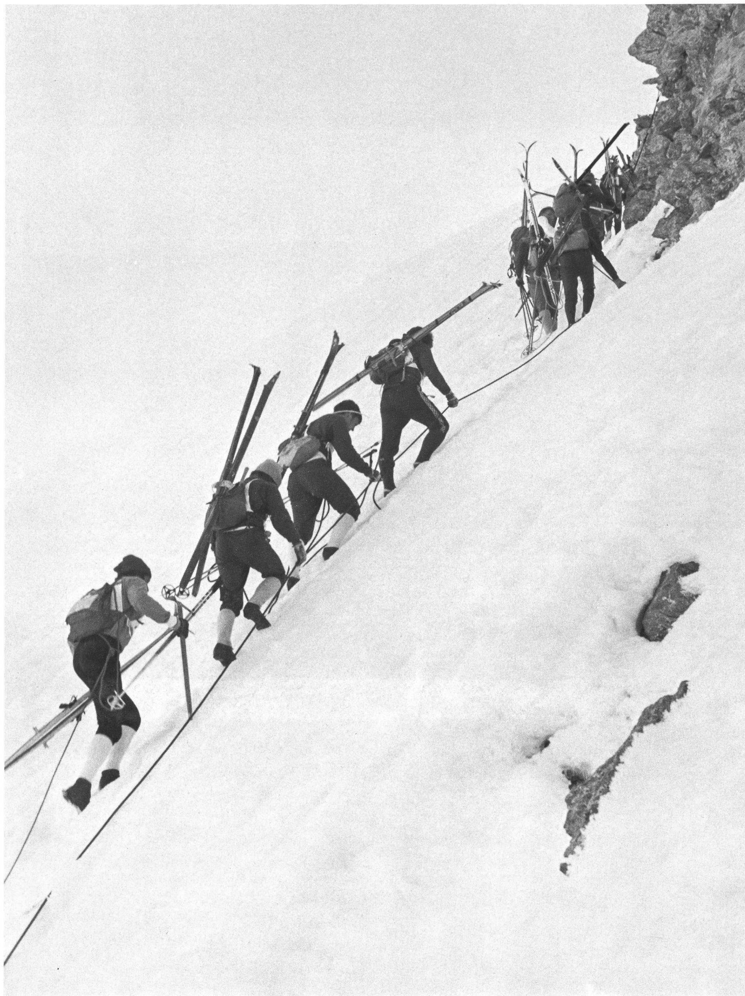
Le 18 avril dernier, le 35e Trophée du Muveran a été un nouveau sujet de fascination.